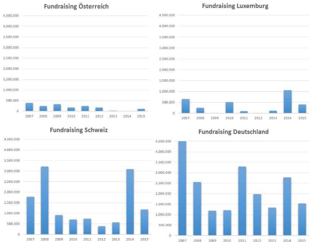
Abb. 1: Entwicklung Fundraising, Österreich, Luxemburg, Schweiz, Deutschland (2007-2015), Quelle Invest Europe Yearbook 2016